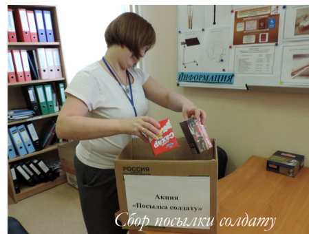
Сбор посылки солдату

«Как живешь ветеран!» (посещение и поздравление на дому маломобильных ветеранов ВОВ). Всего посетили 135 ветеранов.