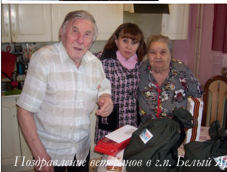
Поздравление ветеранов в г.п. Белый Яр