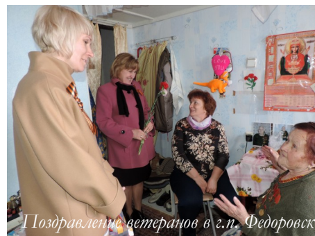
Поздравление ветеранов в г.п. Федоровский